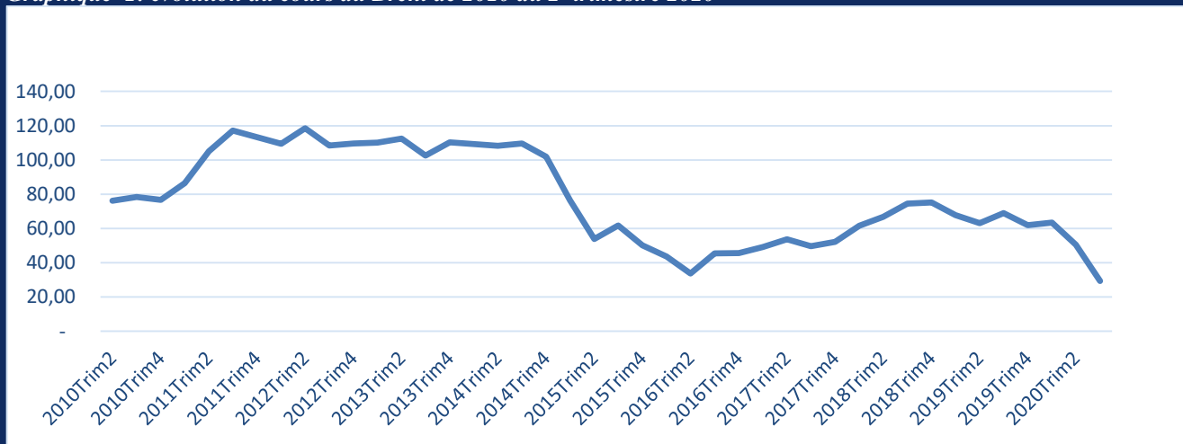
Graphique 1: évolution du cours du Brent de 2010 au 2 e trimestre 2020

Le cours moyen du Brent s'établit à 29,3 dollars américains (USD) au 2 e trimestre 2020 contre 50,4 USD au 1 er trimestre 2020, soit une forte baisse de 41,8%. Cette baisse est causée à la fois par la crise sanitaire mondiale (Covid-19) entraînant une baisse de la demande mondiale du pétrole brut particulièrement dans les pays développés avec les mesures de confinement.